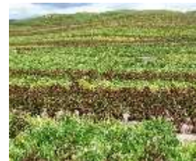
Papa Afectada por Helada