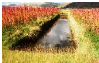
Quinoa de Camellones