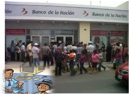
Productor cobra Indemnización