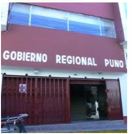
BENEFICIARIO CON POLIZA N° 50005113